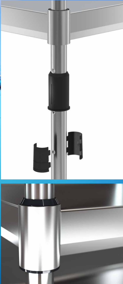
Stabile Klemmverbindung und starke Schweißnähte für maximale Traglast

Das VARIOCART hält die Strapazen des härtesten Alltags aus.